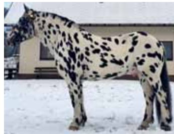
Norikerhengst Firon Elmar XIV