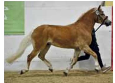
Haflingerhengst Noakley BE