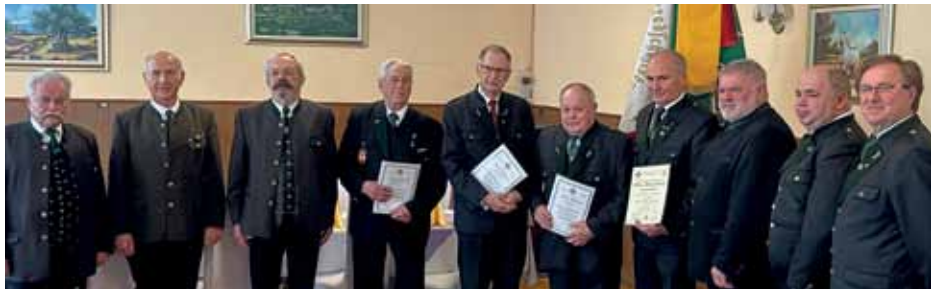
Die anwesenden Ausgezeichneten mit den Ehrengästen und Funktionären.